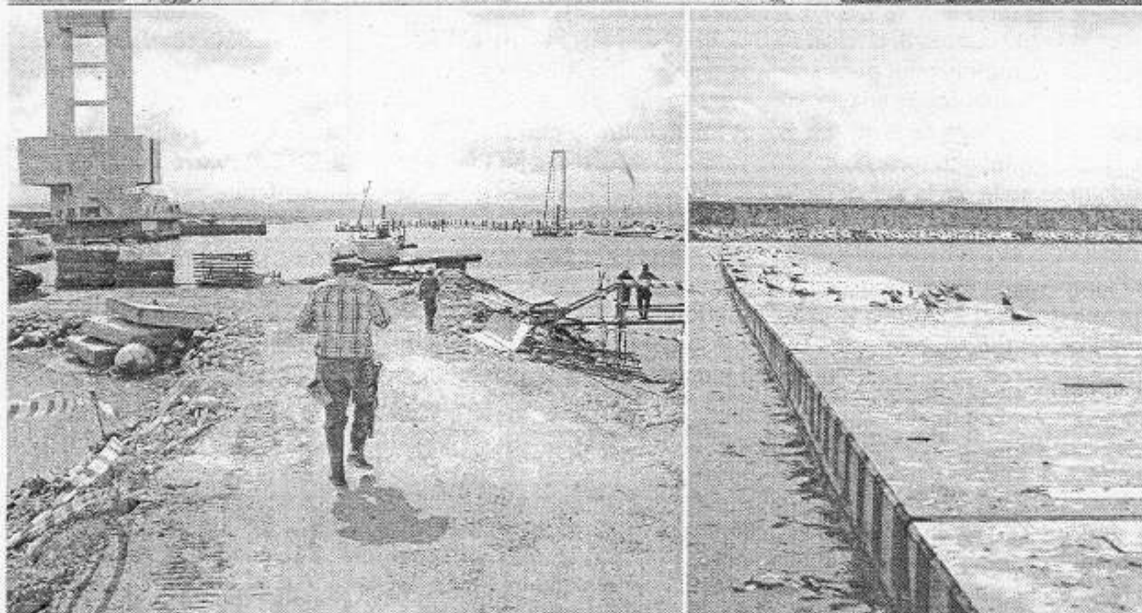
Las obras avanzan a buen ritmo entre el castillo de San Antón y el dique de abrigo